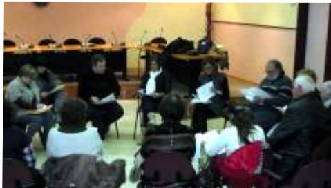
Reunión del consejo municipal de Bienestar Social el pasado 3 de febrero, en el que se propuso de manifiesto la necesidad de realizar varias actividades formativas para combatir y prevenir enfermedades.