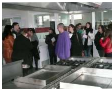
Alumnos del curso de auxiliar de restaurante y bar en el aula del centro de formación.