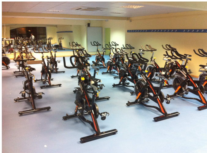
Sala de ciclo indoor del PMD

Los usuarios del gimnasio que cumplan con un trimestre de inscripción se beneficiarán de un bono de 3 usos, con el que podrán acceder gratuitamente a: piscina climatizada, clases de ciclo Indoor, Pilates, body fitness, body combat o aquagym.