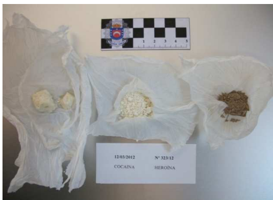
Sustancias intervenidas en la operación "CRACK" que dio lugar a la detención de 3 personas por un Delito contra la Salud Pública

En el año 2012 se ha procedido a la detención o imputación de 55 personas por los agentes de Policía Local debido a la comisión de algún hecho delictivo. Todos los detenidos han sido puestos a disposición Judicial por el Puesto de Guardia Civil.