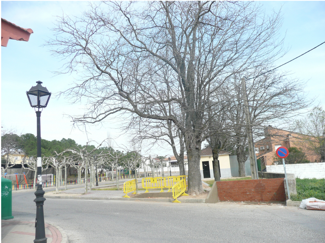
En este espacio se van a ubicar los diferentes contenedores de basura.