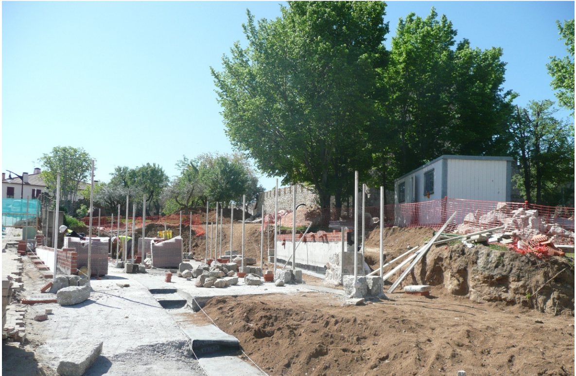
Imagen de las obras para la construcción del nuevo centro de visitantes

amateur en la Muestra de Teatro Aficionado. Una atractiva agenda cultural, que está impulsando el desarrollo económico de San Martín.