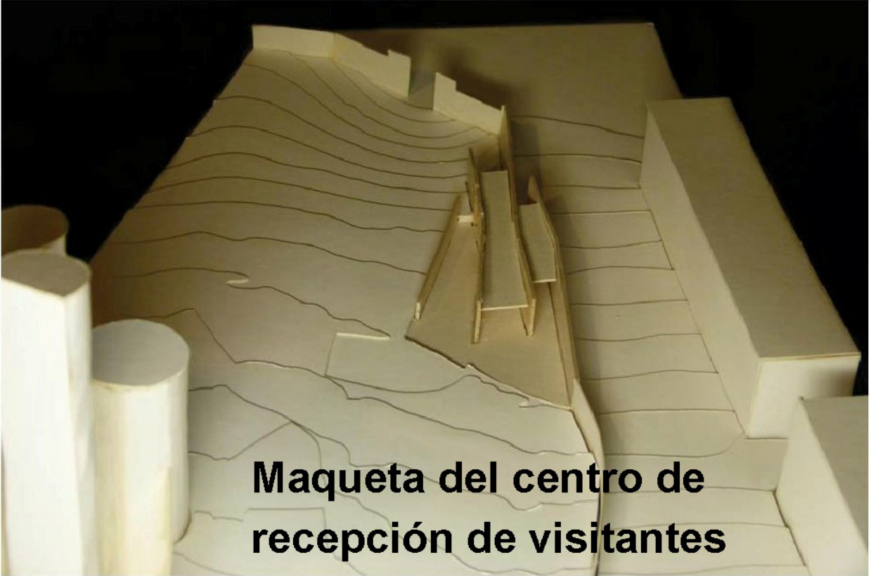
Maqueta del centro de recepción de visitantes