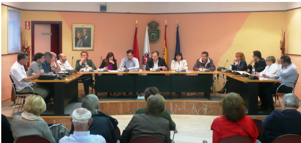
Imagen del pleno ordinario celebrado ayer.