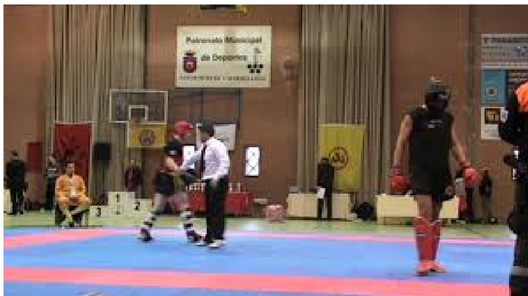
Imágenes de l torneo celebrado en 2013.