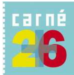
Imagen 02.- Logotipo programa Carné +26