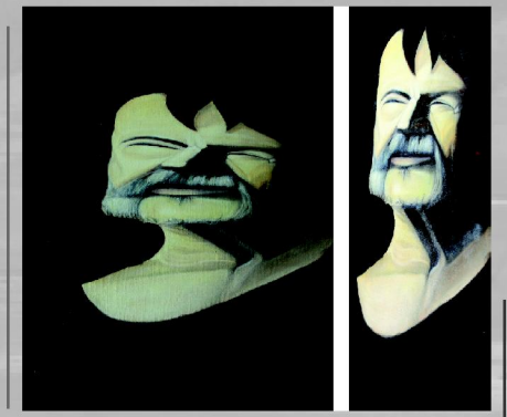
Anamorfosis de un filósofo