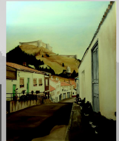
Castillo de Aguilar