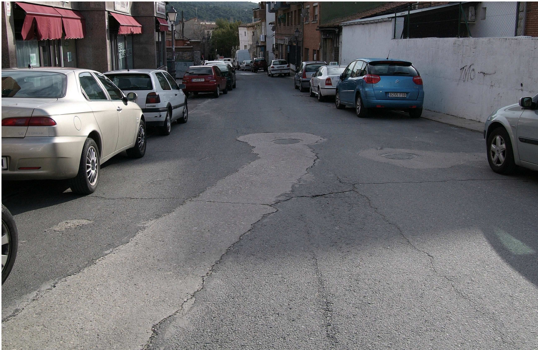
Imagen 01.- Calle Fuente