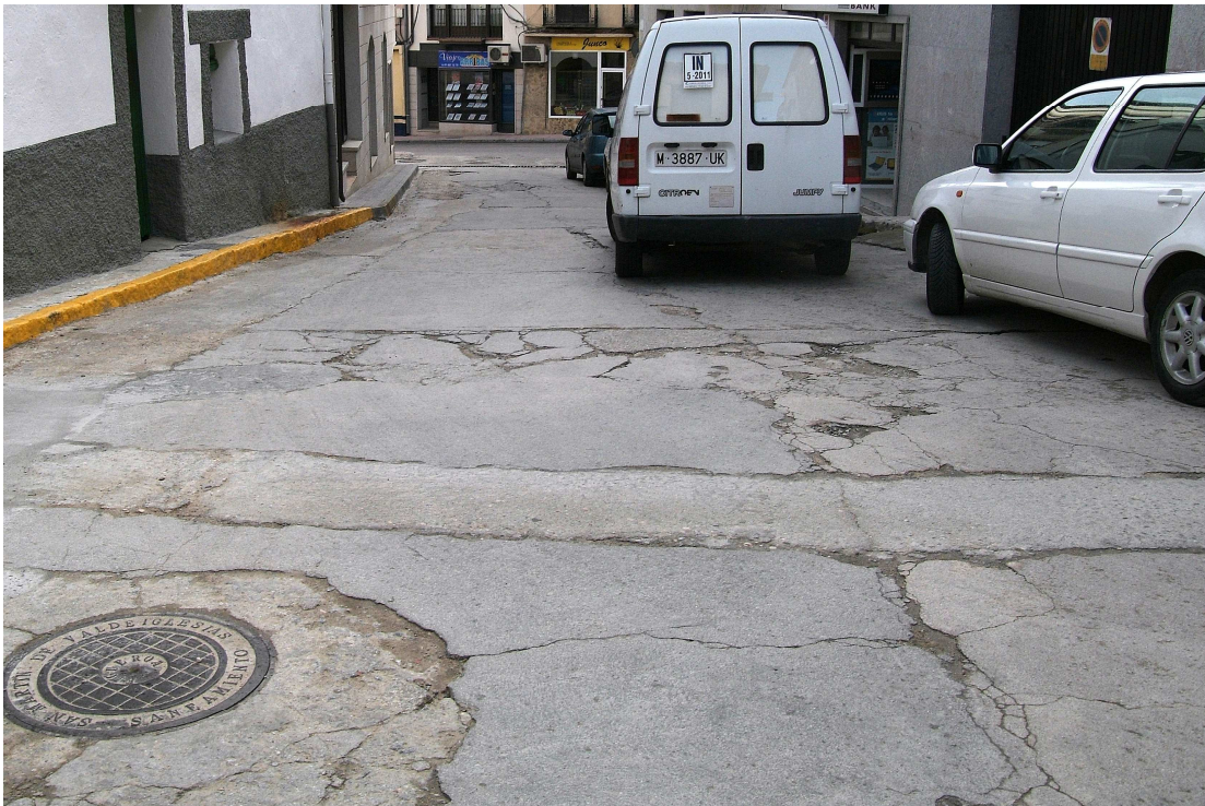
Imagen 02.- Calle Carretas