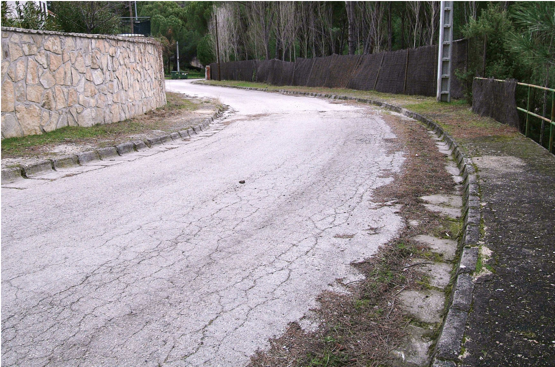
Imagen 03.- Calles Bergantín y Goleta