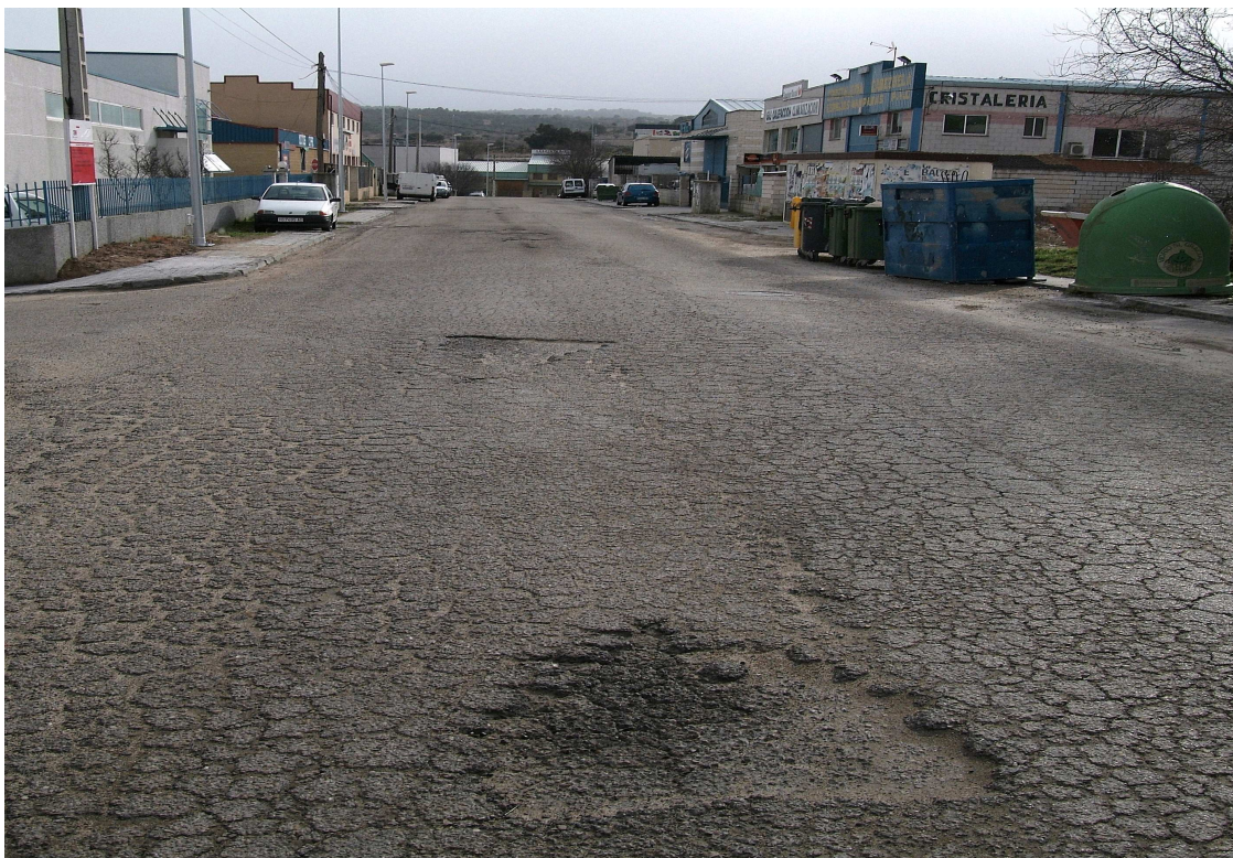
Imagen 04.- Polígono industrial