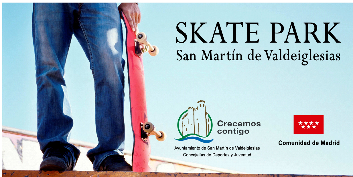
Imagen 04.- Cartel del nuevo Skate Park de San Martín de Valdeiglesias financiado por la Comunidad de Madrid.