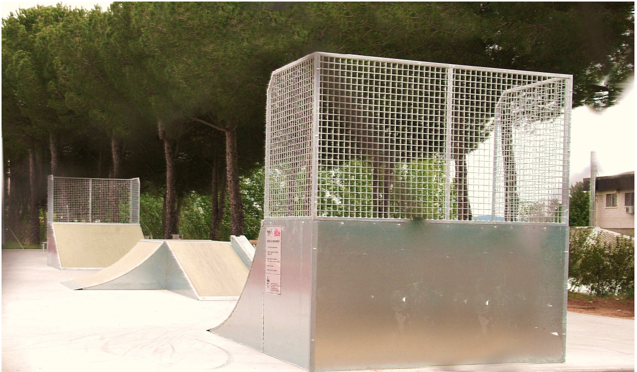
Imagen 01.- Vista de varios elementos de la nueva zona para monopatines de las instalaciones deportivas municipales.