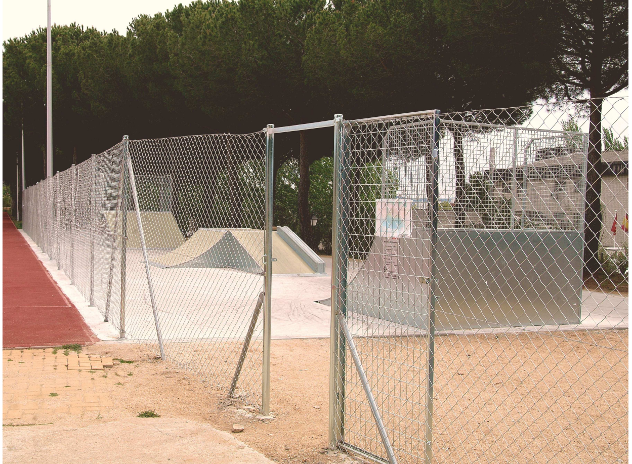
Imagen 02.- La seguridad es una de las claves de estas instalaciones que se encuentran separadas de las pistas de atletismo por una valla metálica.