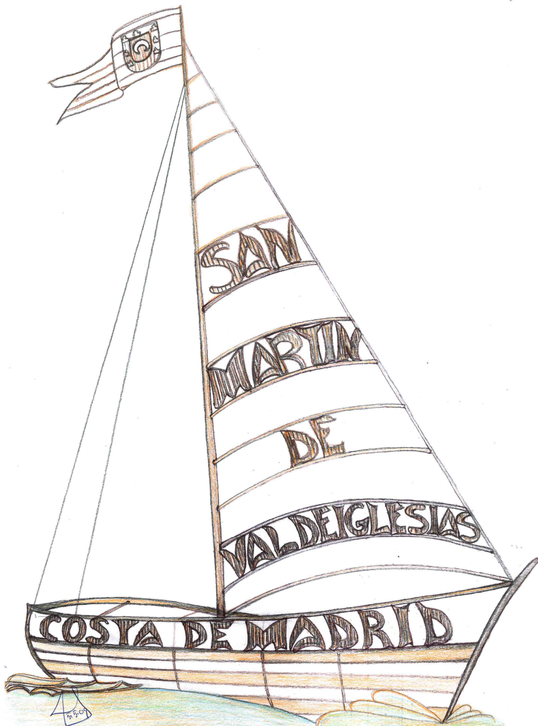
Imagen 01.- Boceto del barco que será instalado en la rotonda y cuyo diseño se variará para incluir algunas de las letras en la propia rotonda.