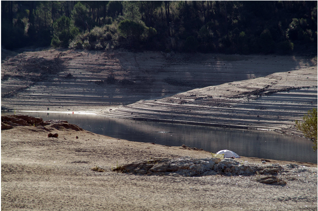
Imagen 01.- Estado actual del Embalse de San Juan tras el desembalse de agua de las últimas semanas.