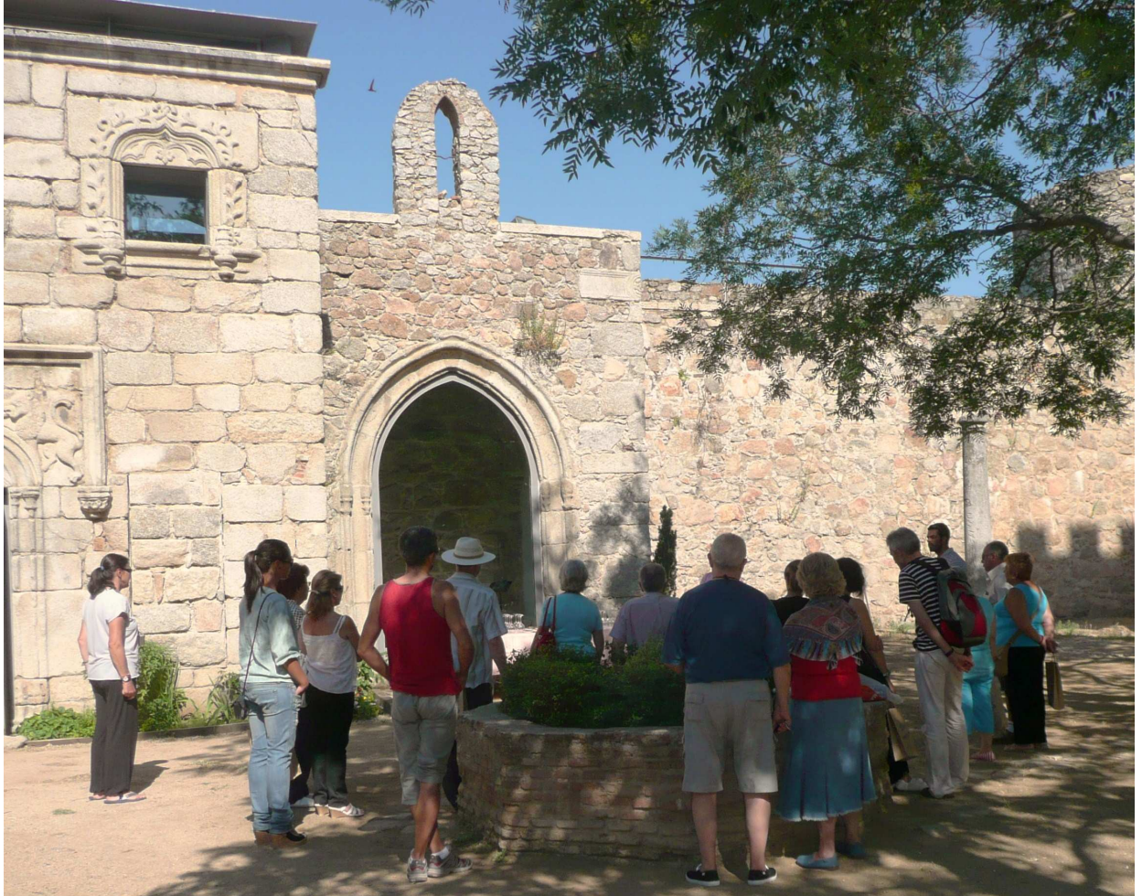
Imagen 01.- Visitantes atienden a las explicaciones del guía de la Oficina Municipal de Información Turística