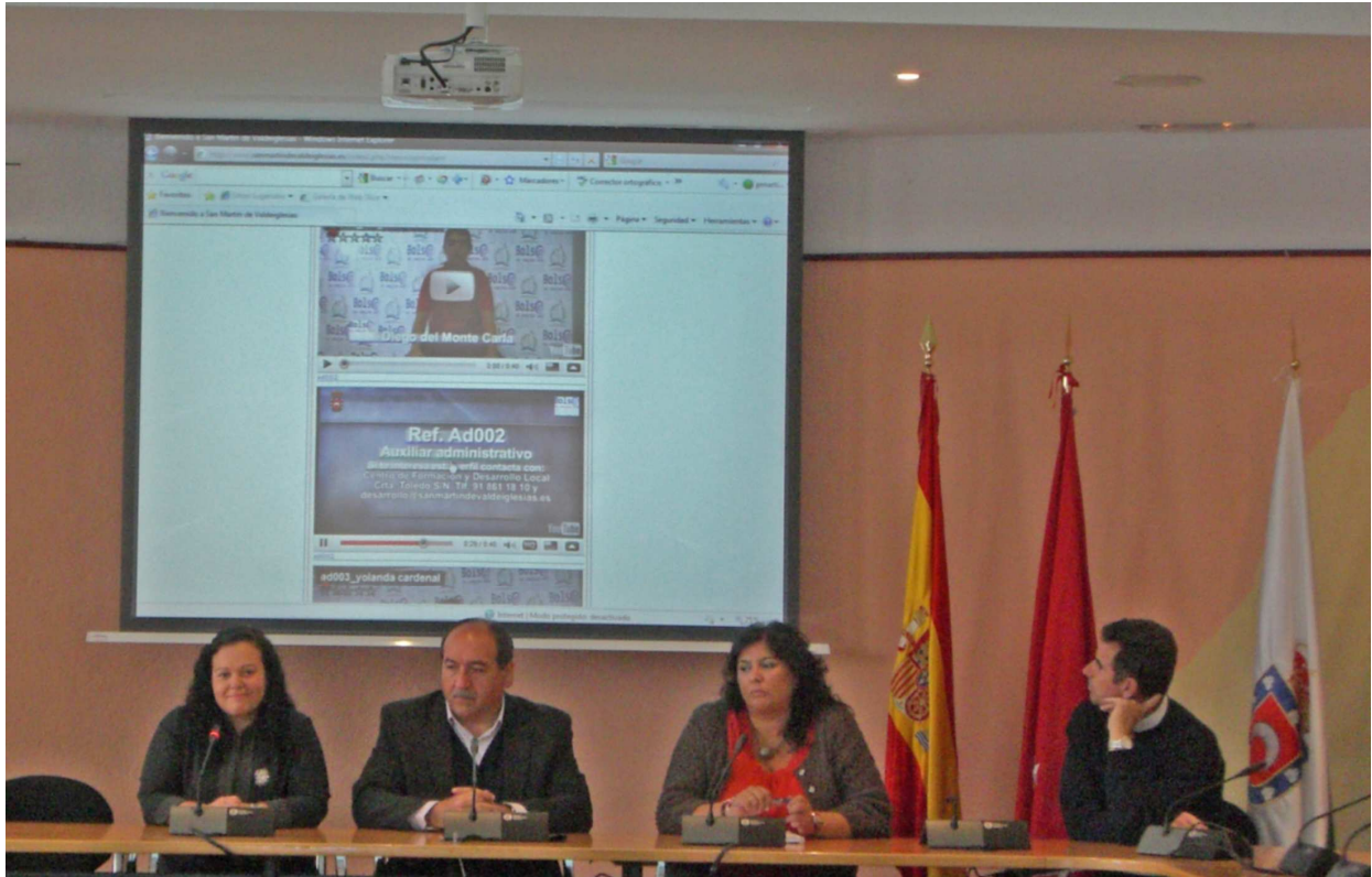
Imagen 01.- Presentación del programa de video-currículum de la Bolsa de Empleo Web para fomentar la contratación en San Martín de Valdeiglesias.