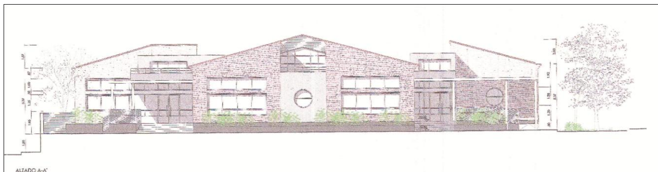
Imagen 01.- Alzado imagen nuevo edificio de aulas C.E.I.P. San Martín de Tours.