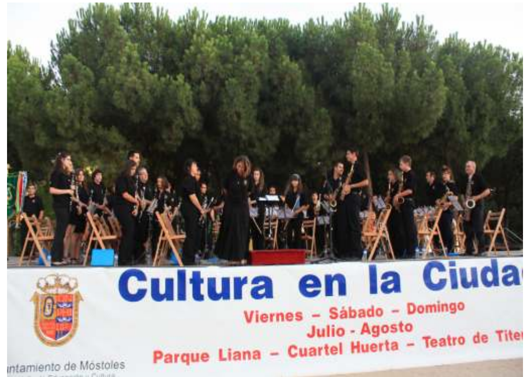
Concierto Parque Liana Móstoles 07/08/2011