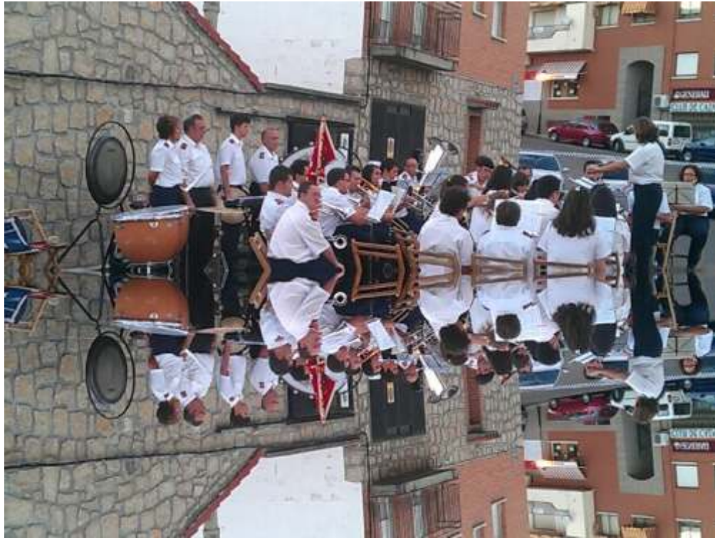
Concierto de Barrio La Dueña 17/07/2011