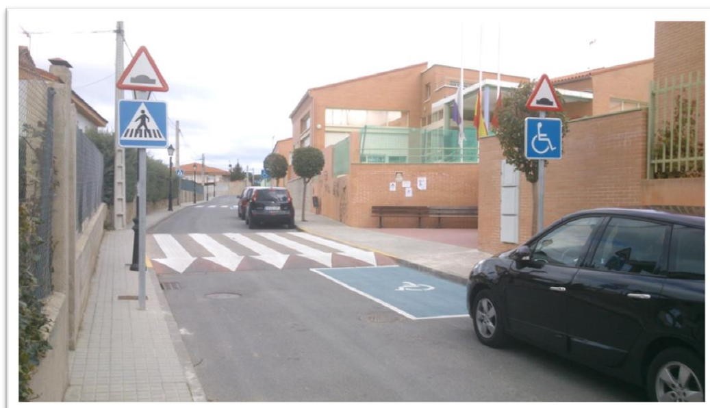
PLAZA PARA PERSONAS DE MOVILIDAD REDUCIDA EN COLEGIO SAN MARTIN DE TOURS