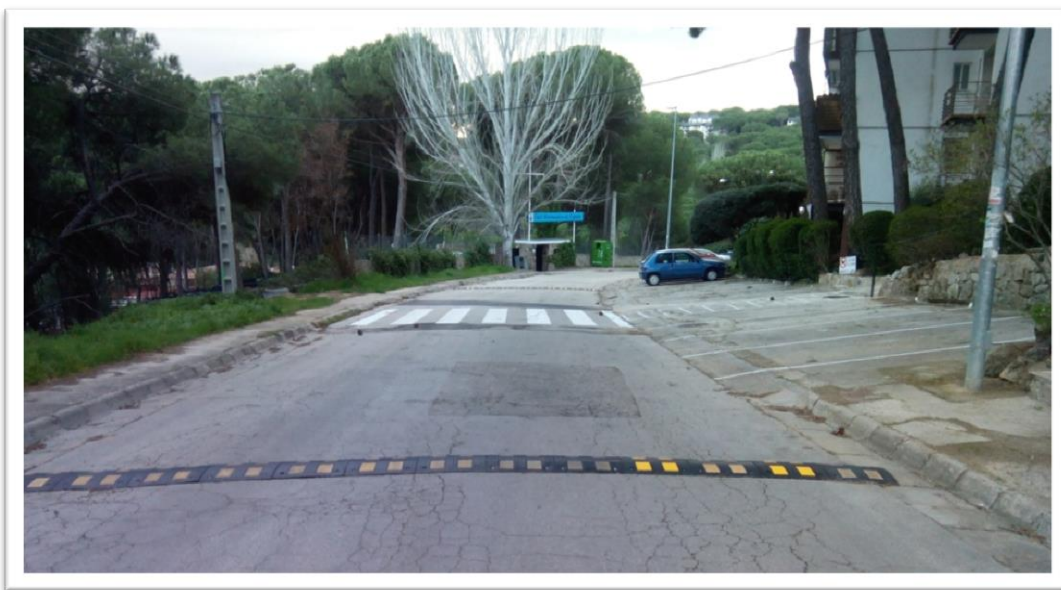
PASO DE PEATONES Y REDUCTOR DE VELOCIDAD EN AVDA DEL GALEON (URB. COSTA DE MADRID)