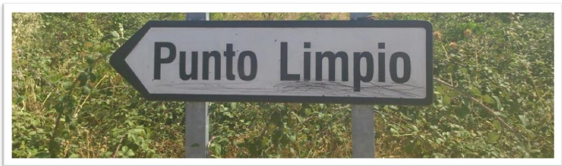
LIMPIEZA PANEL INDICATIVO "PUNTO LIMPIO"