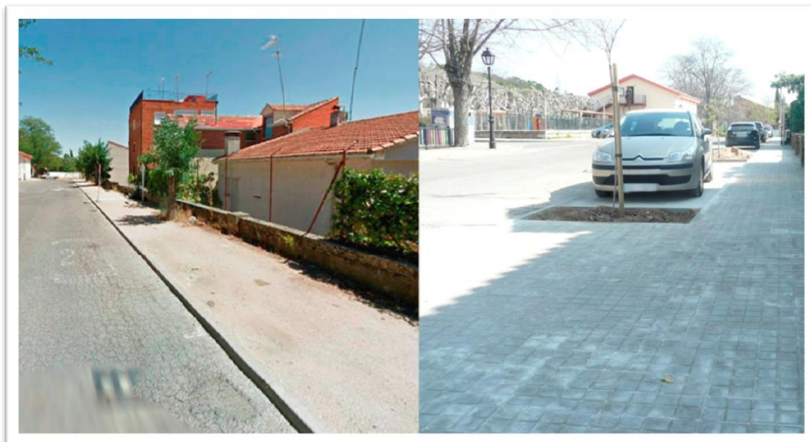
CREACIÓN DE 14 PLAZAS DE ESTACIONAMIENTOS Y MEJORA DE LA ACCESIBILIDAD PEATONAL