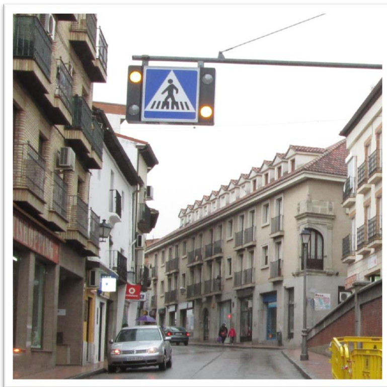
INSTALACIÓN DE LUMINOSO EN TRAVESIA PRINCIPAL

En total se han instalado un total de 27 señales verticales en distintas calles del municipio, mejorando la señalización y la ordenación del tráfico.