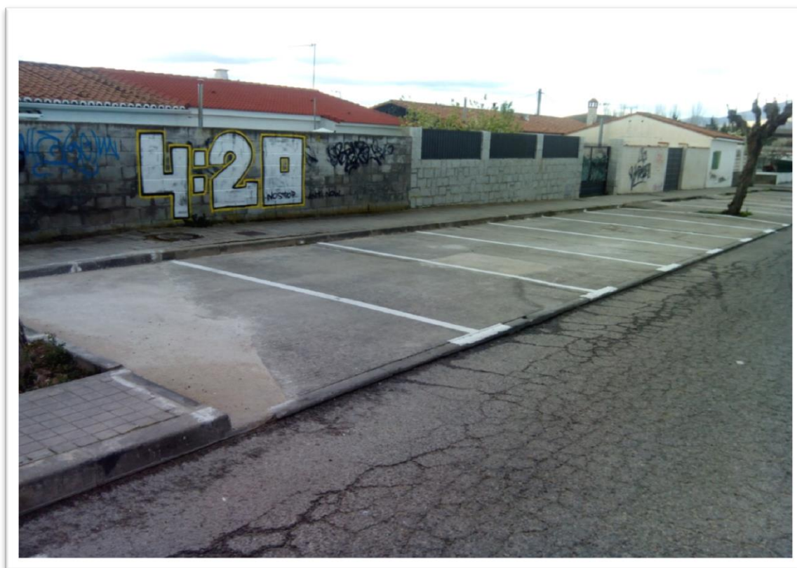
CREACIÓN Y DELIMITACIÓN DE PLAZAS DE ESTACIONAMIENTO EN AV. FERROCARRIL.