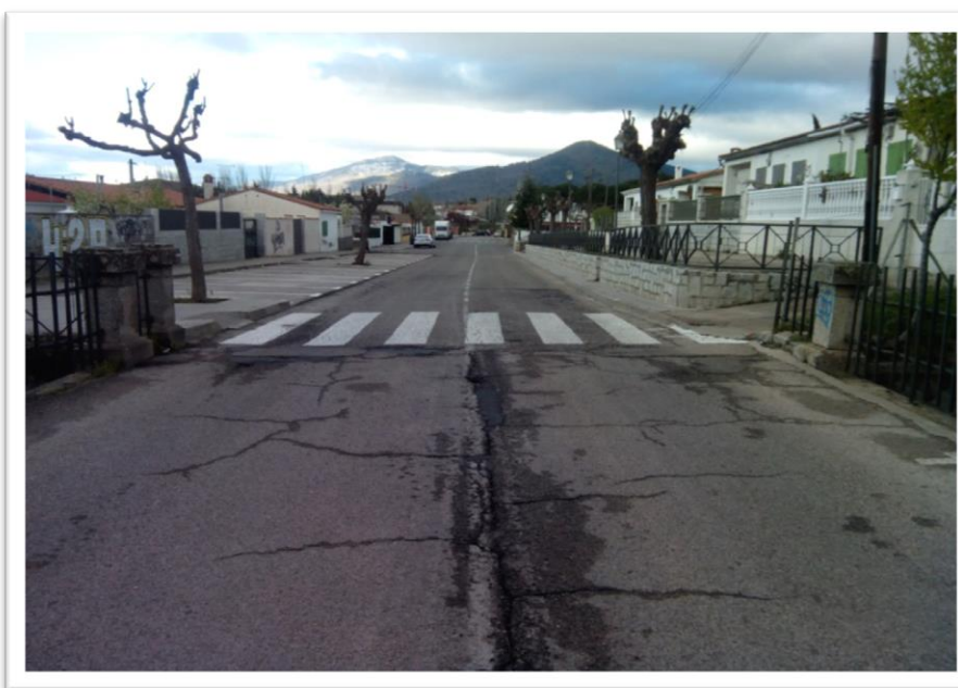
PASO DE PEATONES EN AVENIDA DEL FERROCARRIL