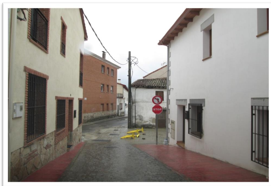
NUEVA SEÑALIZACIÓN EN CALLE ROSARIO